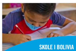
SKOLE I BOLIVIA