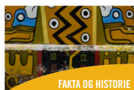
FAKTA OG HISTORIE