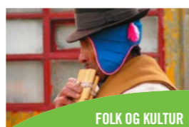
FOLK OG KULTUR