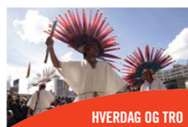
HVERDAG OG TRO