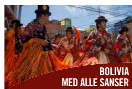
BOLIVIA MED ALLE SANSER