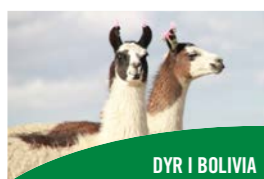
DYR I BOLIVIA