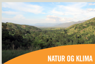
NATUR OG KLIMA