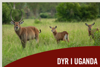
DYR I UGANDA