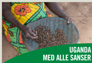
UGANDA MED ALLE SANSER

På vores hjemmeside under menupunktet LÆSERAKETTEN finder du et stort elevunivers om Uganda. Her er en bred vifte af baggrundsmateriale fordelt på ni temaer med film, billedserier, artikler, lege, opskrifter og meget mere.