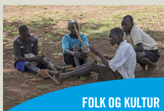
FOLK OG KULTUR