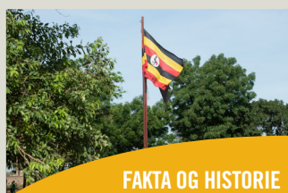
FAKTA OG HISTORIE